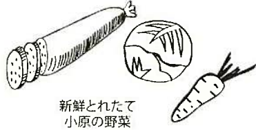
新鮮とれたて 小原の野菜