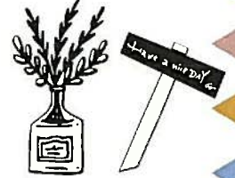
古材、空き缶をリメイクした アンティークJUNK雑貨