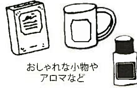
おしゃれな小物や アロマなど