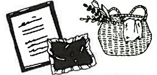
手作りのバックや 小物ポーチ!