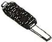
特Aミネアサふっくら五平餅