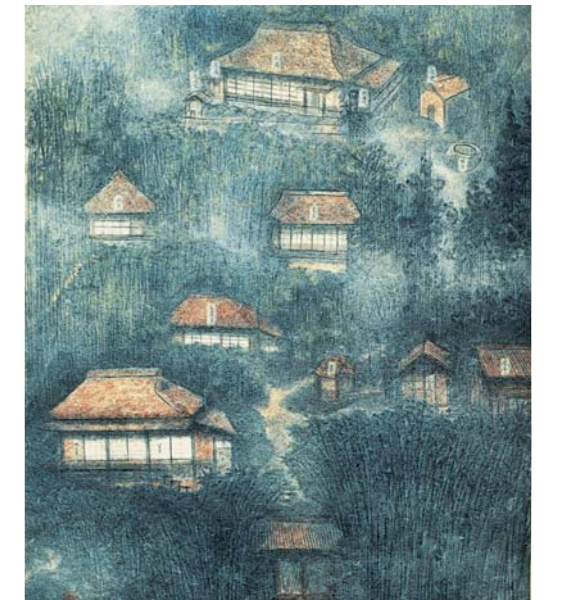
春日井 正義「鳥屋平図」(藤井のアトリエ)

現在小原では「文化芸術によって村を興し、発展させよ」という藤井の高い志を継ぐ豊田小原和紙工芸作家によって、額絵、襖、屏風、一閑張、そのほか現代の生活様式にも溶け込む壁紙やランプシェードなどが制作されています。