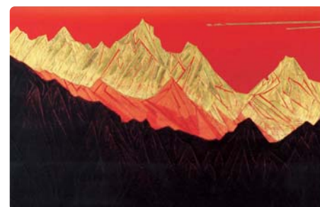
加納 俊治「輝光II シャモニーにて」※ ※印の写真は作品の一部を掲載しています